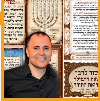
"מבחינתי עשיתי עסקה". גיל והכרזות

רבי ישעיה פיק'ברלין התפלא מדוע לא הזכירו הבית יוסף והאחרונים גם את דעת רב האי גאון והרמב"ם. לדעתו, יש לברך גם על כוכב שביט, כדעתם, על־כף פנים בלי שם ומלכות.