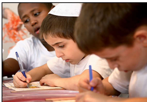
הנחלת היהדות לדור הצעיר

ראוי שחודש הלימודים הנוסף ייוחד להעמקת הידע במורשת ישראל. זו הזדמנות לשלב כוחות חדשים, בעלי זיקה עמוקה ליהדות