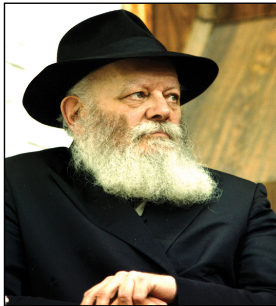
הרבי. אהבה אל כל יהודי באשר הוא

איך נופלות פתאום כל המחיצות המבדילות בין הקבוצות כאן בארץ, והכול מתקבצים יחדיו וחוגגים את החג כמשפחה אחת?