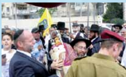
הרב מנשה בן פורת רוקד לכבודה של תורה

של בית החולים, וחזר ליעודו המקורי - מקום לתורה ותפילה עבור עובדי "רשות השידור". בערב חג השבועות, חגגו עובדי הרשות, חיילי יחידת דודבן, ילדי בית הספר חורב, יחד עם הרבנים הגאונים שליט"א, ובראשם הרב הגאון משה שלמה עמאר שליט"א, את חנוכת בית הכנסת, והכנסת ספר התורה למקום. היה זה מחזה מרגין לב של אחדות ישראל: חרדים, דתיים לאומיים, חיילונים, חסידים וחיילים, רקדו חבוקים לכבודה של תורה. כל המחיצות נפלו באחת לנוכח ספר-תורה. נקווה, שהמקום ישפיע השפעה חיובית על שידורי רשות השידור.